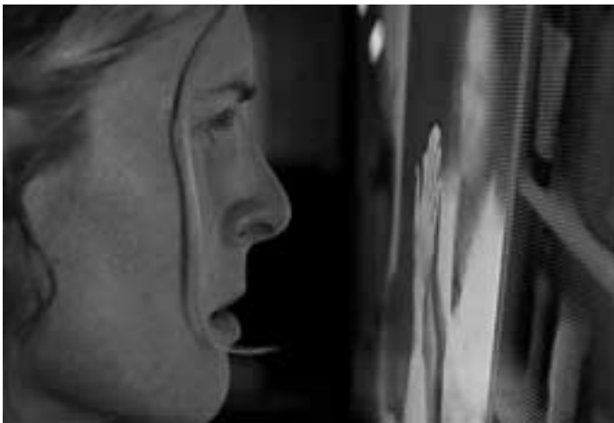
Solitaire er et åtte minutter langt drama om en kvinne som lever alene. En kveld finner hun en eske med videokassetter i leiligheten sin. Kassetten viser seg å inneholde opptak av henne...

Festivaldeltakelse regnes som svært viktig, både for å gjøre norsk film kjent for et utenlandsk publikum, for å sikre filmer god distribusjon til andre festivaler verden rundt og bidra til salg av filmen. I rapporten til fondet opplyser Bekkavik at filmen fikk god mottakelse, og at den senere har deltatt på andre festivaler. Det ble også gitt tilskudd fra Utenriksdepartementet og Norsk filminstitutt, men deltakelse på festivalen ville ikke ha vært mulig uten bidraget fra fondet.